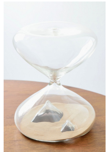
Céline Cléron, Le repos en Egypte , 2013, verre soufflé et sable, 40 cm x 25 cm (diamètre)