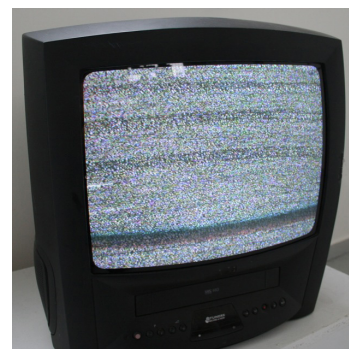
Nicolas Aiello, Neige , 2010, dessin animé en boucle (4 min) réalisé à partir de 25 dessins à l'encre de la série Berlin